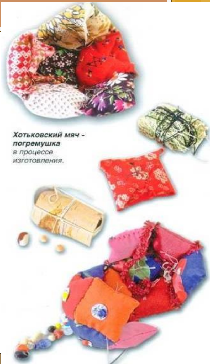
Хотьковский мяч - погремушка в процессе изготовления.